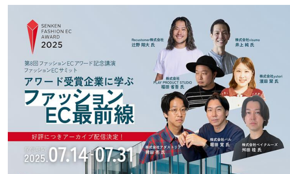
セミナー事例：織研新聞社主催ファッションECアワード