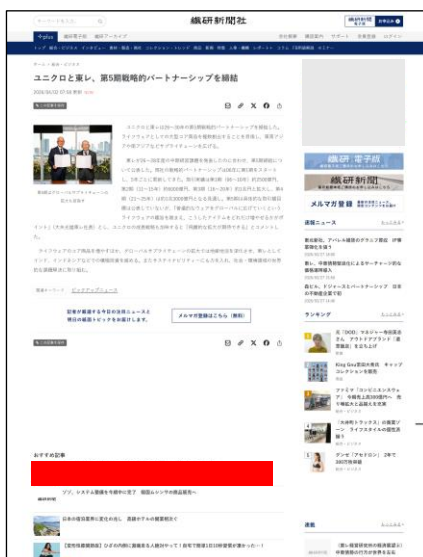
<記事下レコメンド>