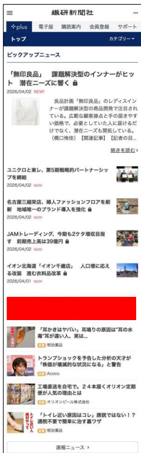
<スマホインフィード>