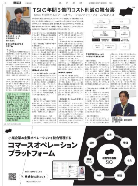
< 織研新聞記事広告 >